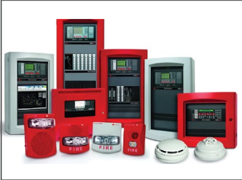
نظام انذار الحرائق FIRE ALARM SYSTEM