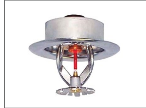
نظام رش المياه لمكافحة الحرائق FIRE SPRINKLER SYSTEM