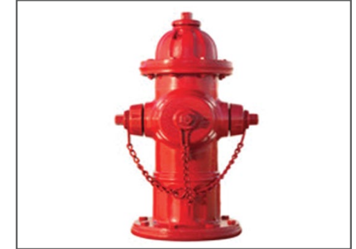
أنظمة مأخذ (فوهات) الحريق الخارجية (حنفيات الحريق) FIRE HYDRANT