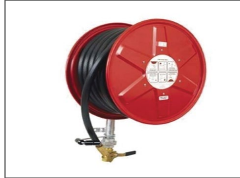
بكرات خرطوم إطفاء الحريق FIRE HOSE REEL SYSTEM