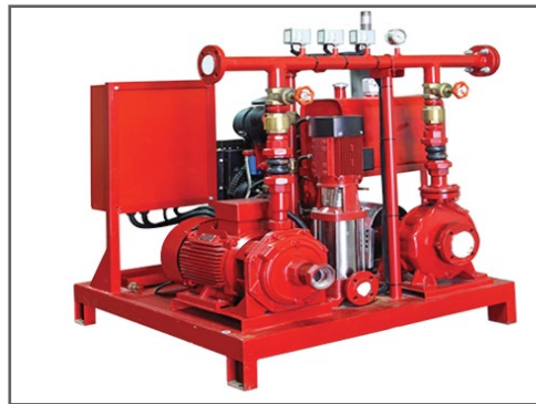
مضخات مكافحة الحريق FIRE PUMP SYSTEM